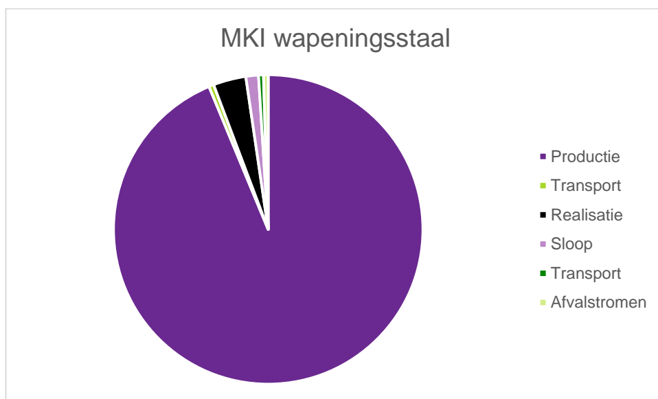
Figuur 3: MKI-verdeling van wapeningsstaal